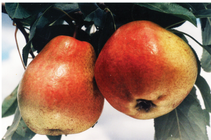
Рис. 4. Сорт груши Дива Fig. 4. Pear variety 'Diva'

Дива (рис. 4). Сорт зимнего срока созревания, получен на Крымской опытной станции садоводства от свободного опыления сорта Оливье де Серр. В плодоношение вступает на третий год, высокоурожайный (35–40 т/га), отличается высокой зимо- и засухоустойчивостью, устойчивостью к парше и термическому ожогу листьев. Плоды высоких товарных и вкусовых качеств. Цветет в средние сроки.