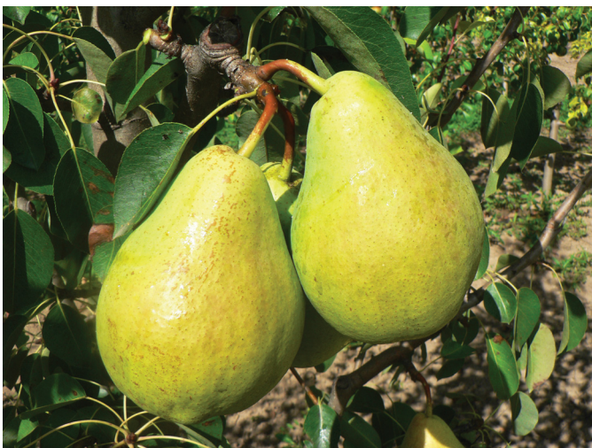
Рис. 2. Сорт груши Лучистая Fig. 2. Pear variety 'Luchistaya'

ожогу листьев. Плоды яркоокрашенные, высоких товарных и вкусовых качеств. Цветет в средние сроки.