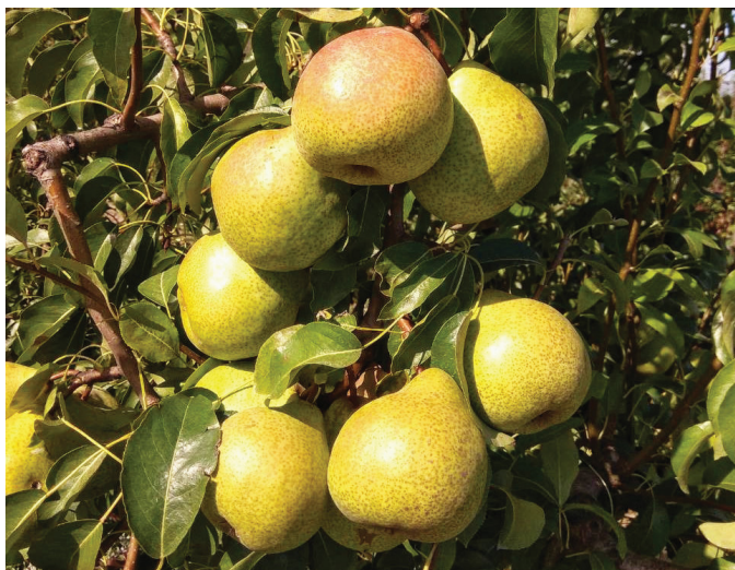
Рис. 3. Сорт груши Рада Fig. 3. Pear variety 'Rada'