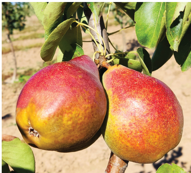
Рис. 1. Сорт груши Очарование Лета Fig. 1. Pear variety 'Ocharovaniye Leta'

Очарование Лета (рис. 1). Сорт летнего срока созревания, получен от свободного опыления селекционной формы 65-11 (Деканка Зимняя × Верте). В пору плодоношения вступает на третий год после посадки, урожайность средняя – 15 т/га, максимальная – 51 т/га, отличается хорошей зимо- и засухоустойчивостью, устойчивостью к парше и термическому