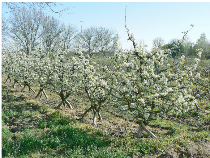
Рис. 3. Самоопорный тип сада способом выращивания «штамбовая пирамида» деревьев груши на айве ВА-29

Fig. 3. Self-supporting type of garden by growing a "standard pyramid" of pear trees on VA-29 quince