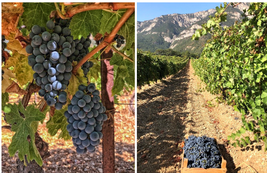
Рис. 2. Урожай винограда технического сорта Каберне Совиньон (филиал «Ливадия, АО «ПАО «Массандра», 2020 г.)